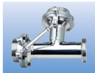
Variante: Mehrwegesystem z.B. Scheibenventil