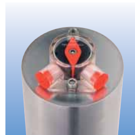
Gut sichtbare Stellungsanzeige mit Aufnahme für zwei induktive Stellungsmelder