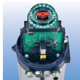
Steuerkopf KI-Top, ASI-BUS-ES mit selektiver Notausschaltung und 2 frei belegbaren Steuer-eingängen