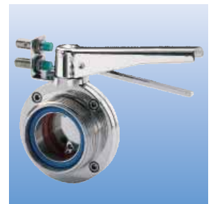
Ausführung mit Endlagenmeldung