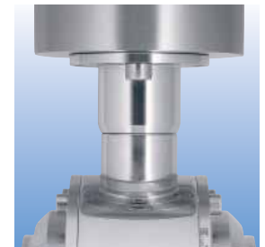
Geschlossene Verbindung von Drehantrieb auf Kugelhahn / Leckage-Scheibenventil